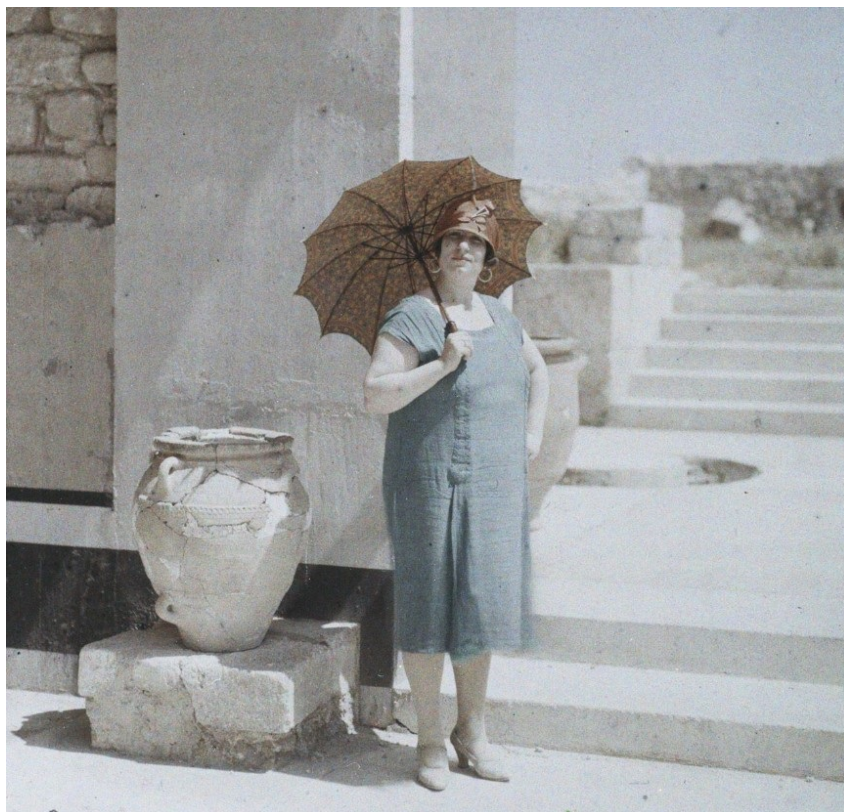
Grèce - Femme d'une quarantaine d'années élégamment vêtue au pied des Propylées sud