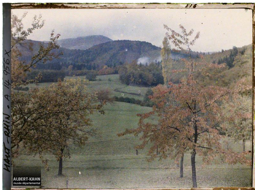
France, Masevaux, Paysage d'Alsace, automne 1918