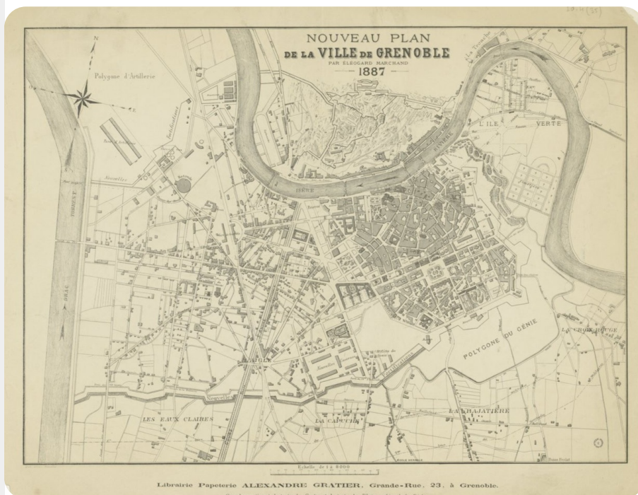
Librairie Papeterie ALEXANDRE GRATIER, Grande-Rue, 23, à Grenoble. carte de Grenoble d'Eleogard Marchand - 1887

Alors voilà : à la faveur d'un "exercice pratique" demandé dans le cadre d'une formation, j'ai décidé de raconter les histoires de ma maison. Et puisque les personnes à qui j'ai commencé à en parler se sont montrées curieuses de connaître la suite... j'ai pensé partager ici une sorte de "journal de bord" de cette enquête domestique.